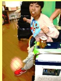
缶つぶし。ねらって、ねらって、えいっ！