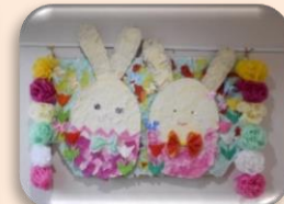
皆で貼り絵をしました。