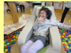
ボールサーフィン、スリリングで最高！！