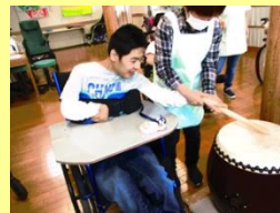
太鼓の達人に挑戦。職員と一緒に真剣に叩きます。