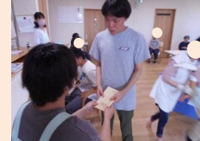
一か月一生懸命働いて、今日は工賃の日！そしてそこから好きなものを買ってお疲れ様会。労働のあとの甘いものは最高！