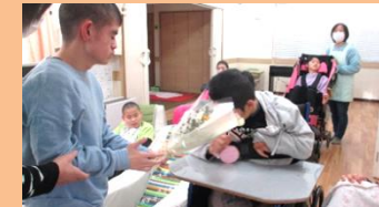
ご卒業おめでとうございます。寂しくなるけど、また、会えるものね！