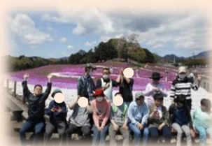
芝桜を見に行きました。ピンクと白の絨毯のようです。