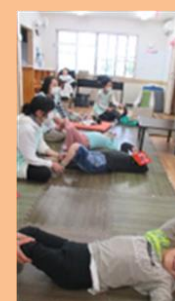
マッサージ気持ちいいね～！

今年度は卒業生を送り出し、新たに1名の方をお迎えしました。皆さん、一つ学年があがり、少しお兄さん、お姉さんになられたように感じます。平日の放課後等デイサービスは短い時間ではありますが、一人一人にとって意味のある時間を過ごしてもらえるように支援していきたいと思ひます。