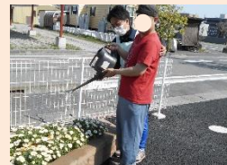
新しくできたグループホーム「あんど」の花壇です。じょうろでお水をあげました。