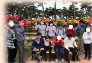
薔薇園にも行きました。色とりどりの薔薇が満開でした。