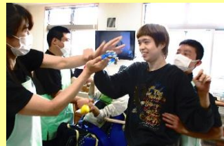
それぞれのスタイルでダンス！みんな、ノリノリでした！