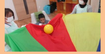
パラシュートで、風を感じました。ふわふわが気持ちいい～！