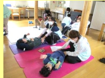
マンツーマンでマッサージ。リラックスできる時間です。