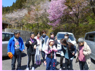
満開の桜をみて、みんなで散歩！

4月1日に開所となった生活介護【くるみ】です。定員は20名。始まったばかりなので、少人数で活動を始めています。利用者さんも職員も「はじめまして」の方ばかりですが、1ヶ月が経ち、それぞれの個性をお互いに分かり合えてきたところです。これからも、活動をする中で、理解を深め、楽しい時間を過ごしていきたいと思ひます。