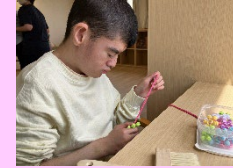
個別課題に取り組んでいます。真剣です！！