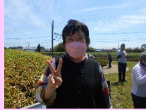
公園に出かけ、たくさん歩きました。緑も風も気持ちいい～！