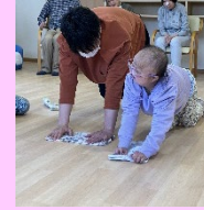
おそうじも、一緒にやると楽しいね！！