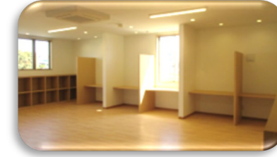
生活介護くるみ（20名）活動室