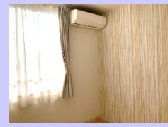
防音室ですが、他の部屋と変わりなく安心してご利用いただけます。

平成31年度より6床の短期入所として事業を開始した「さらい」は4年が経過し、契約者数は130名を超えました。予約日は朝から電話がひっきりなしにかかってくる状況で、希望通りに利用できない方もたくさんいらっしゃるのではないかと思います。今年度、新たに8床の短期入所「ここあ」を開所しました。今までの経験から、夜間眠れず声が出てしまう方や動きの激しい方が利用されていても、他の方の眠りの妨げにならないように、防音の部屋も二部屋用意しました。様々な状況に配慮できるよう、工夫しながら、少しでも自宅での生活を応援できるようにと願っています。