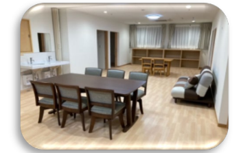
短期入所ここあ（8名）談話室