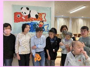
こいのぼりの貼り絵をしました。ちぎって貼って・・・力作です。