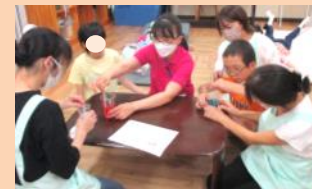
みんなでスライム作り。職員も一生懸命です。