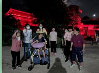
お月見に行きました。臨江閣もライトアップ。