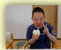
工賃をもらったあとのお楽しみ。みんなで「おつかれさま!」