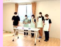
さえずり隊の合唱です。

若達者な職員に恵まれ、楽しい時間を過ごしています。少人数なので、散歩、図書館、公園、買い物・・・フットワークよく動いています。一日の流れに慣れ、混乱なく動けるようになったことは大きな進歩です。