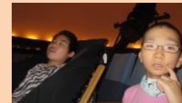
今年の夏休みは、生涯学習センターや高崎少年科学館に出かけました。プラネタリウムも体験できました。