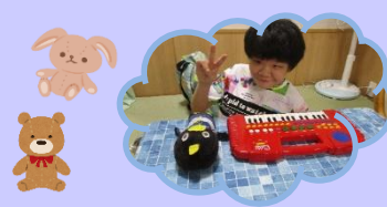
自宅から持ってきた私のお気に入り！