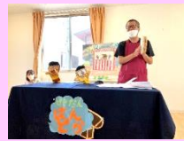
職員によるペーパークラフト。