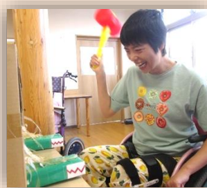
ワニワニバクバク