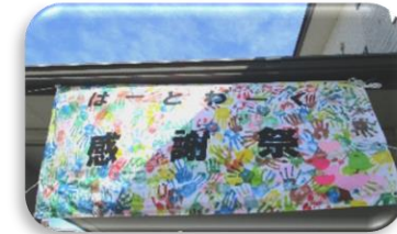
利用者さんと職員の手形で作りしました。