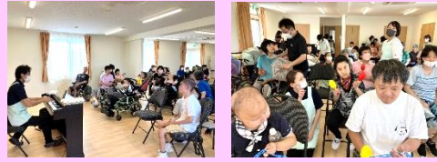
ピアノの上手な実習生さんによるミニコンサート。ぶれも・えるも・くるみの皆で楽しみました。