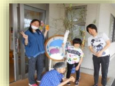
七夕飾り。願い事はなにかな?