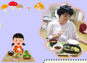
今日の夕食はなにかなあ？