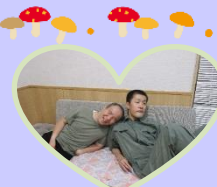
さらいで知り合いました！

新型コロナウイルスが第5類になってから、見学者が増えています。まずは一度ご利用いただいて、となると、今までご利用いただいていた方は更に予約が入りにくくなったり、とご迷惑をおかけしています。緊急対応ができる短期入所が足りていない、ということを実感しています。