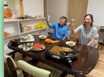
地域の夏祭りに招待していただき、楽しい時間を過ごしました。そして、ホームに帰って、かんぱ〜い。御馳走が並んでいます!