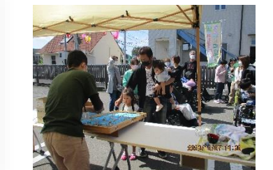
スマートボールとヨーヨー釣りも大盛況