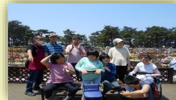
バラ園に行きました。お天気も良くてバラも満開!

今年4月にできた福祉避難所で避難訓練。それぞれの事業所から歩いて避難所に向かいました。初めての「道」に戸惑って足が前に出ない人、反対方向に行ってしまう人・・・危険や緊急を感じ、スムーズに避難ができるように何回も練習を積み重ねていきます。