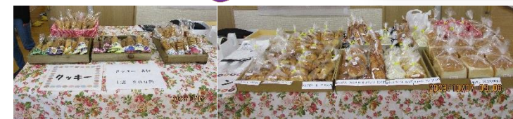
大学園のクッキー、あかぎの響のパン、サニーズマーケットの野菜、光明園のうどん・・・とってもおいしかったです！