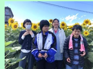
ひまわりがいっぱい! 青空もきれいで気持ちいい~

今年の4月から利用を始めた方1名を加え、7名での生活にも慣れ、楽しく過ごしています。食事が終わり、夜にお出かけできるのも、グループホームならではの活動です。花火を見に行ったり、今年はお月見にも行きました。職員の計画力、フットワークの良さ、そして何よりも協力し合えることで楽しみは倍増すると実感しています。