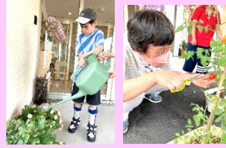
早く大きなあれ！一生懸命お水をやって・・・収穫です！

4月に開所し半年が経ちました。お互いに理解し合えてきたかな……。職員と一緒に色々なことに挑戦する日々です。