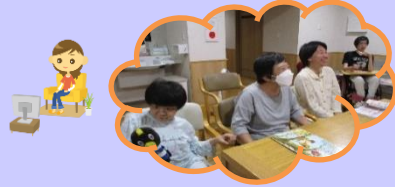
みんなでテレビを鑑賞中。