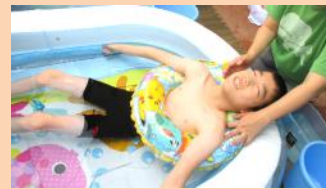
ミニプールでぶかぶか...暑い時はこれが一番!

同じ学校のお友達だけでなく、みらいで会ったお友達とも仲良くなれたらいいなあ。そして、みらいで会えることが楽しみにになるといいなあ。そんな気持ちで一緒に過ごしています。また、少人数ならではの活動も楽しんでいただけたらと思います。